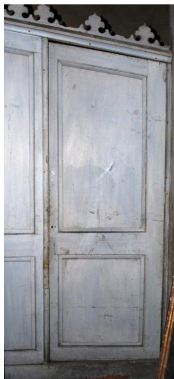
Pohled od vstupu na oratoř 110216 hl 098

Očistit, opravit mechanické poškození, opravit a zretušovat povrch (jako u TR/7), provést repasi kování (odstranit degradované nátěry, zbavit koroze, doplnit kopiemi chybějící nebo nevhodně doplněné díly - zachovat maximum historických částí, opatřit protikorozním nátěrem, opatřit 2x vrchním krycím nátěrem – černý).